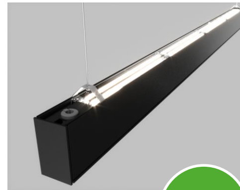
ALFA Z direct/ indirect

Alfa Z direct/indirect soveltuu työpistekohtaiseen valaistukseen ja kouluvalaistukseen erikseen ohjattavien ylä- ja alavalaisimien ansiosta. Mahdollistaa mukautuvat modulaariset jono- ja kehäratkaisut. Jatkoprofiileihin on mahdollista asentaa kohdevalaisimet integroituun valaisinkiskoon.